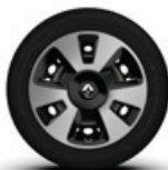
15" keréktárcsák fekete-ezüst díszítéssel