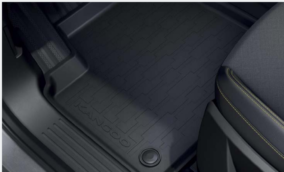
Hattýnyakás vonóhorog, gumiszőnyeg