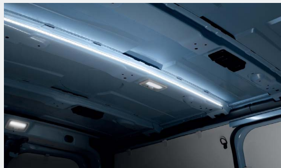
LED csomagtér világítás